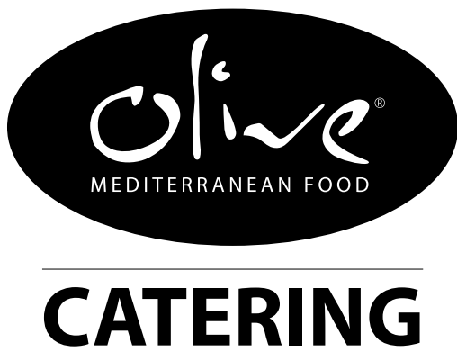
Varianta 1 Černé provedení logotypu

Černobílá varianta se používá, když je technologicky či esteticky nemožné použít základní variantu značky. Volba barevného provedení závisí na technologických možnostech (všude, kde je to možné se preferuje barevné provedení).