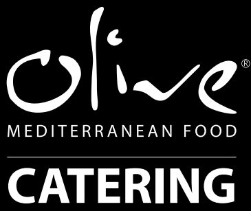
Varianta 2 Bílé provedení logotypu